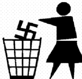
NICHT strafbar: eindeutige antifaschistische Symbole

Das im März gesprochene Urteil stärke, wie erwartet, die politische Kultur des öffentlichen Protests und motiviere, auch in Zukunft vielfältige und kreative Aktionsformen gegen Rechtsextremismus und Neonazis zu praktizieren. Die Tabuisierung und quasi Mythologisierung von Symbolen helfe nicht weiter, fördere vielmehr auch deren Vergessen und unterstütze, ob gewollt oder ungewollt, eine Art "Schlussstrich-Mentalität" gegenüber der NS-Zeit, sagt Berninger und weist darauf hin,